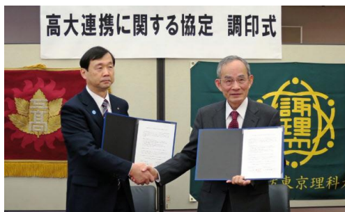
・公立諏訪東京理科大学