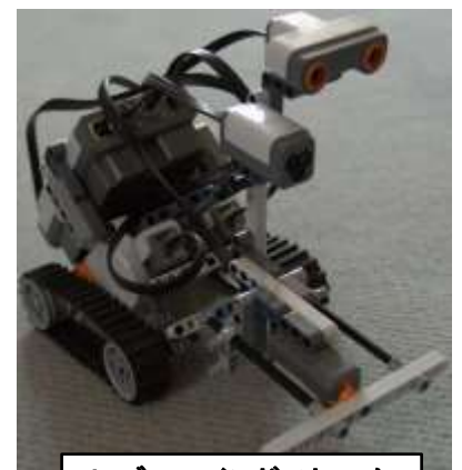
レゴ・マインドストーム