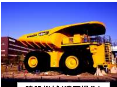
建設機械(遠隔操作)