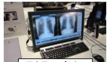
医療用コンピューター