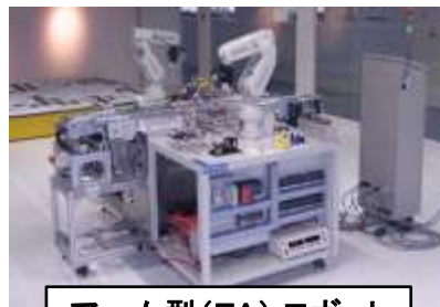
アーム型(FA) ロボット