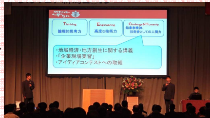
600名を超える聴衆の前でのプレゼンテーション

さんフェア内の企画の一つとして、SPH事業の発表会が開催されました。全国のSPHの研究指定を受けている高校のうち、20校がポスター展示を行い、その中の11校がステージ上で学んだ成果等について発表を行いました。工業をはじめ、商業、農業、看護、水産、家庭、情報の領域からの発表が行われました。