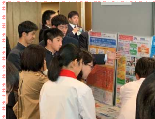
ポスターセッション