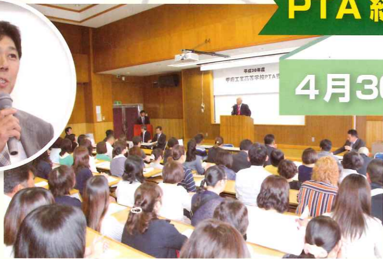
多数の保護者参加のなか、PTA 総会が開催されました。