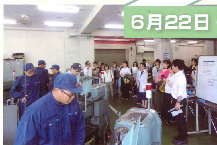
PTA 女性部会による実習見学会が実施されました。