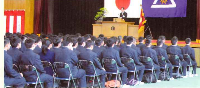
伝統ある甲府工業高等学校へ272名の新生が入学いたしました。